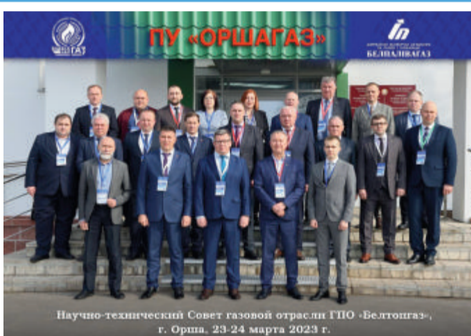
Научно-технический Совет газовой отрасли ГПО «Белтопгаз», г. Орша, 23-24 марта 2023 г.

Оршанского района, где участникам были продемонстрированы: периметральная система видеонаблюдения и бесключевая система управления доступом на основе электронно-механического замка и ID-карт, выполнение работ по осмотру технического состояния ГРП путем обхода с применением мобильного приложения «Мириада», а также применяемая маркировка оборудования ГРП QR-кодами. Полученные участниками научно-технического Совета яркие впечатления, а также выработанные решения и поставленные задачи помогут перевести работу по дальнейшему совершенствованию производственных процессов, а также повышению качества оказываемых услуг на качественно новый уровень.